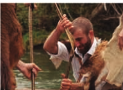
Segundo premio / Bigarren saria 2025. Autor / Egilia: Alberto García Sesma.