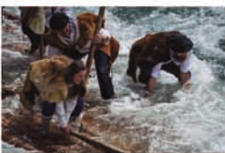
Tercer premio / Hirugarren saria 2025. Autor / Egilia: Iván Santamaría.